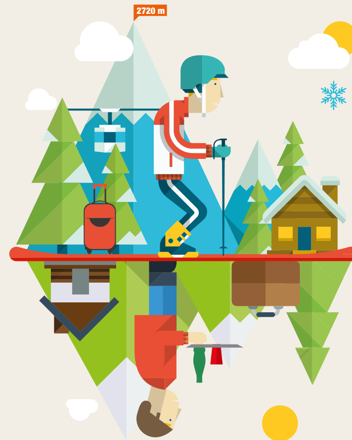
CRÉATION : ATELIER-CONTUREMAISON.COM